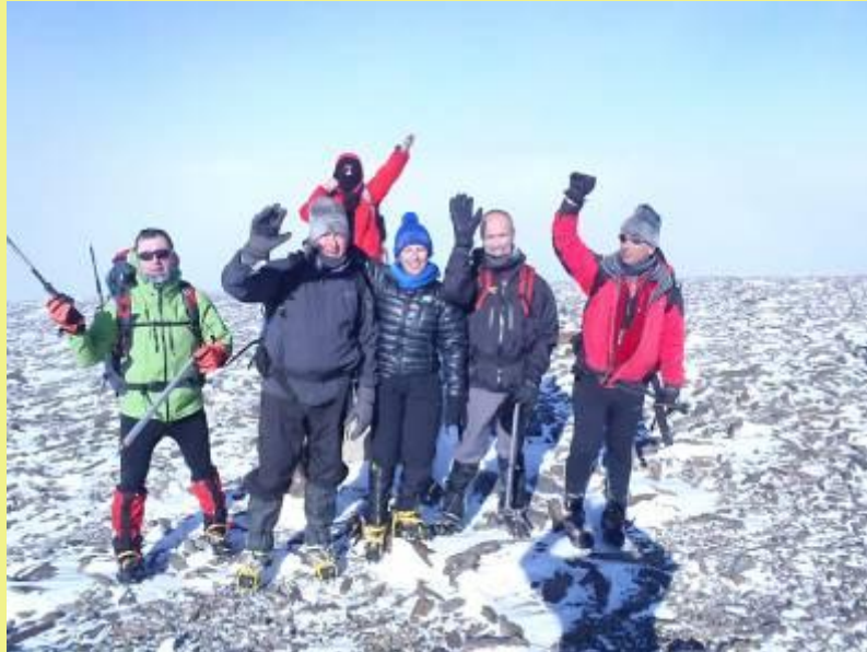
Cumbre del Picón de Jerez

Domingo: Nos iremos al Barranco del Alhorí, y seguiremos realizando prácticas con piolets y crampones, autodetención, técnicas de aseguramiento con distinto material, aseguramiento en glaciares, etc. Si nos da tiempo, y existen las condiciones idóneas, podemos ver la posibilidad de realizar alguna ascensión algún pico cercano o hacer algún corredor sencillo.