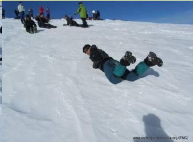
Autodetención con piolet

Material Necesario y Obligatorio: Botas de Goretex, aptas para la nieve, Crampones y piolet, arnés (opcional), casco (opcional), mochila 30-40 litros, ropa de abrigo (no olvidar gorro, guantes, buff, etc.), polainas, gafas de sol, protector solar, chaqueta cortavientos, guantes. Saco de dormir (aconsejable, mínimo saco de fibra – 20° C). En el refugio hay calefacción y administra mantas, pero nunca se sabe.